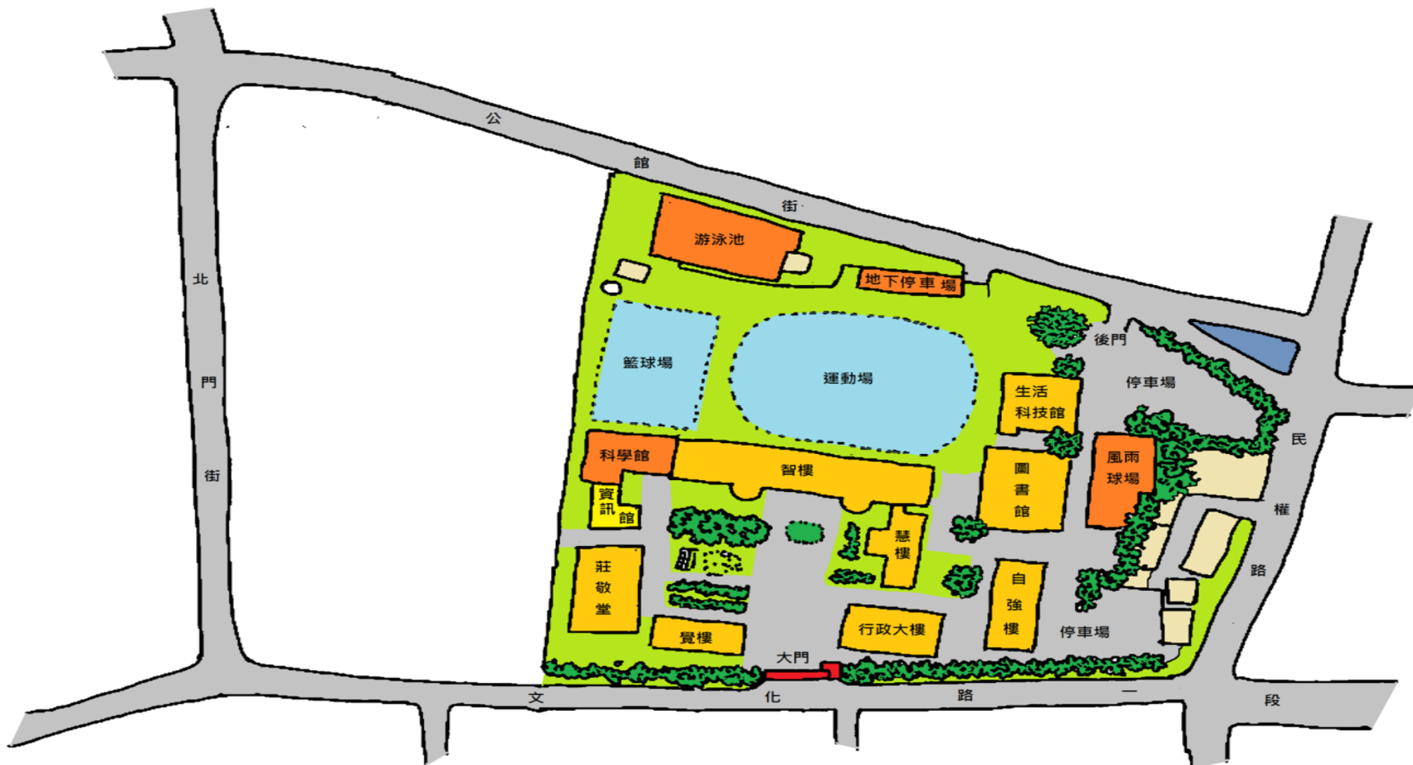
(1)板橋高中停車資訊：